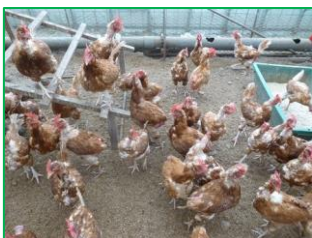
平飼い養鶏の様子

時にはニワトリに威嚇されて蹴られたり突かれたり、外作業中には帽子の上に毛虫が落ちてきたりと色々ありますが、職員の皆さんやメンバーさんに優しい言葉をかけていただき励まされながら日々頑張っています。メンバーさんが気持ちよく作業出来るように、またメンバーさんが自身の目標に向かって前進できるようサポートしていけたらと思います。これからも色々な壁がありくじける時もあると思いますがその度成長できると思い前向きに頑張っていきたいです。よろしくお願い致します。